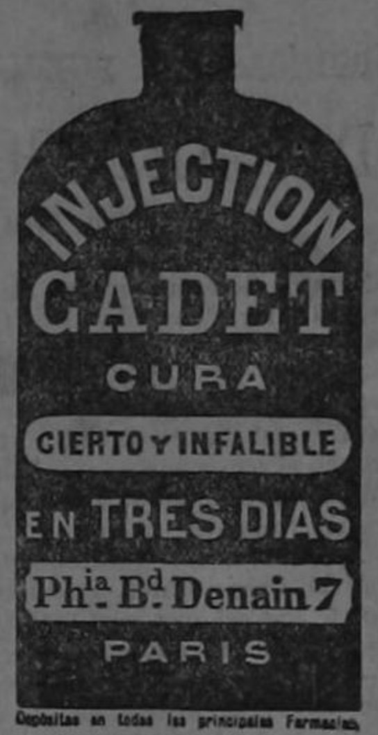
Depositas en todas las principales farmacias.

Agentes generales en Cen. América, Jiménez & Co.